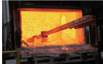
役目を終えたアルミは自社工場から溶解し、再生アルミとして循環利用

建物としての役目を終えたアルミ部材は、資源として再利用。当社の鋳造工場から再生アルミとして生まれ変わり、再び「t 2 -01」の主要構造部材として活躍します。