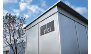
排水機能を備え、室内への漏水を防ぐ独自の屋根材を開発（特許出願中）

屋根や外装などの外皮はすべてアルミで構成。長期間にわたって美観と性能を維持します。定期的な塗装や補修が不要で、メンテナンスコストの削減に貢献します。