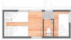
ファミリールーム (2×5)