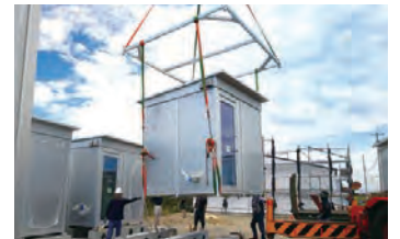
クレーンを使ったユニット単位での設置・移設

工場生産後、トラックで現地へ運び、クレーンで設置します。設置後もユニット単位で『動かせる』特性を活用して、移設や内装改修による再利用が可能。ライフスタイルや使用環境の変化に合わせて、繰り返し使うことができます。