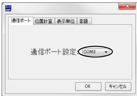
(画面は XA-PA4 の画面です)